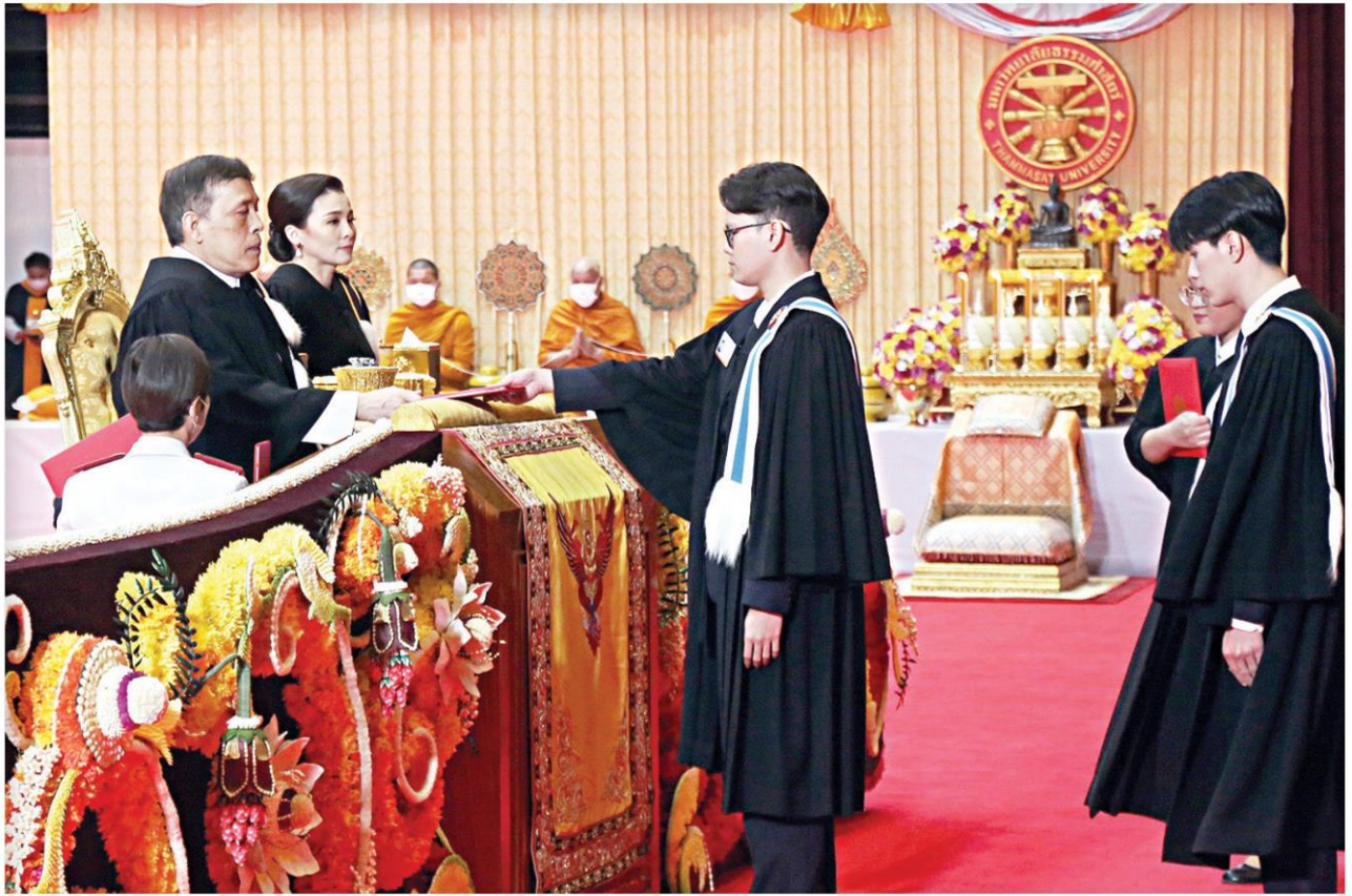
พระบาทสมเด็จพระเจ้าอยู่หัว และ สมเด็จพระนางเจ้าฯ พระบรมราชินี เสด็จฯพระราชทานปริญญาบัตรแก่ผู้สำเร็จการศึกษาจากมหาวิทยาลัยธรรมศาสตร์ ปี 2564 ณ หอประชุมอาคารกิติยาคาร มหาวิทยาลัยธรรมศาสตร์ ศูนย์รังสิต