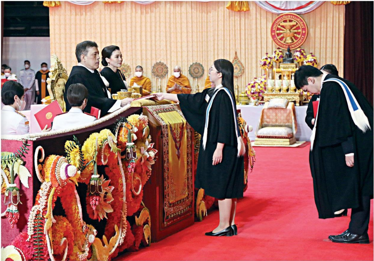
พระบาทสมเด็จพระเจ้าอยู่หัว และ สมเด็จพระนางเจ้าฯ พระบรมราชินี เสด็จฯพระราชทานปริญญาบัตรแก่ผู้สำเร็จการศึกษาจากมหาวิทยาลัยธรรมศาสตร์ ปี 2564 ณ หอประชุมอาคารกิติยาคาร มหาวิทยาลัยธรรมศาสตร์ ศูนย์รังสิต