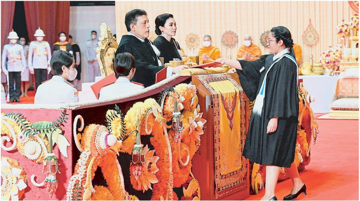
พระบาทสมเด็จพระเจ้าอยู่หัว และ สมเด็จพระนางเจ้าฯ พระบรมราชินี เสด็จไปพระราชทานปริญญาบัตร แก่ผู้สำเร็จการศึกษาจากมหาวิทยาลัยธรรมศาสตร์ ณ มหาวิทยาลัยธรรมศาสตร์ ศูนย์รังสิต เมื่อวันที่ 30 พฤศจิกายน.